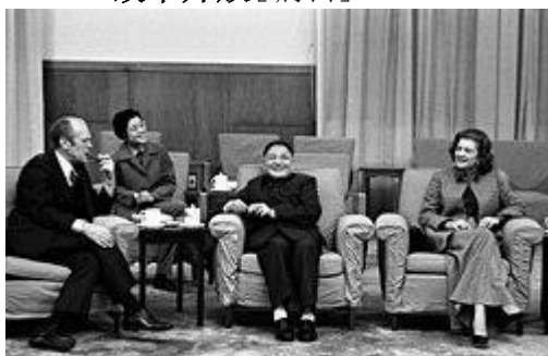
1975年中国国务院副总理邓小平和美国总统杰拉尔德·福特在北京市展开非正式会谈。