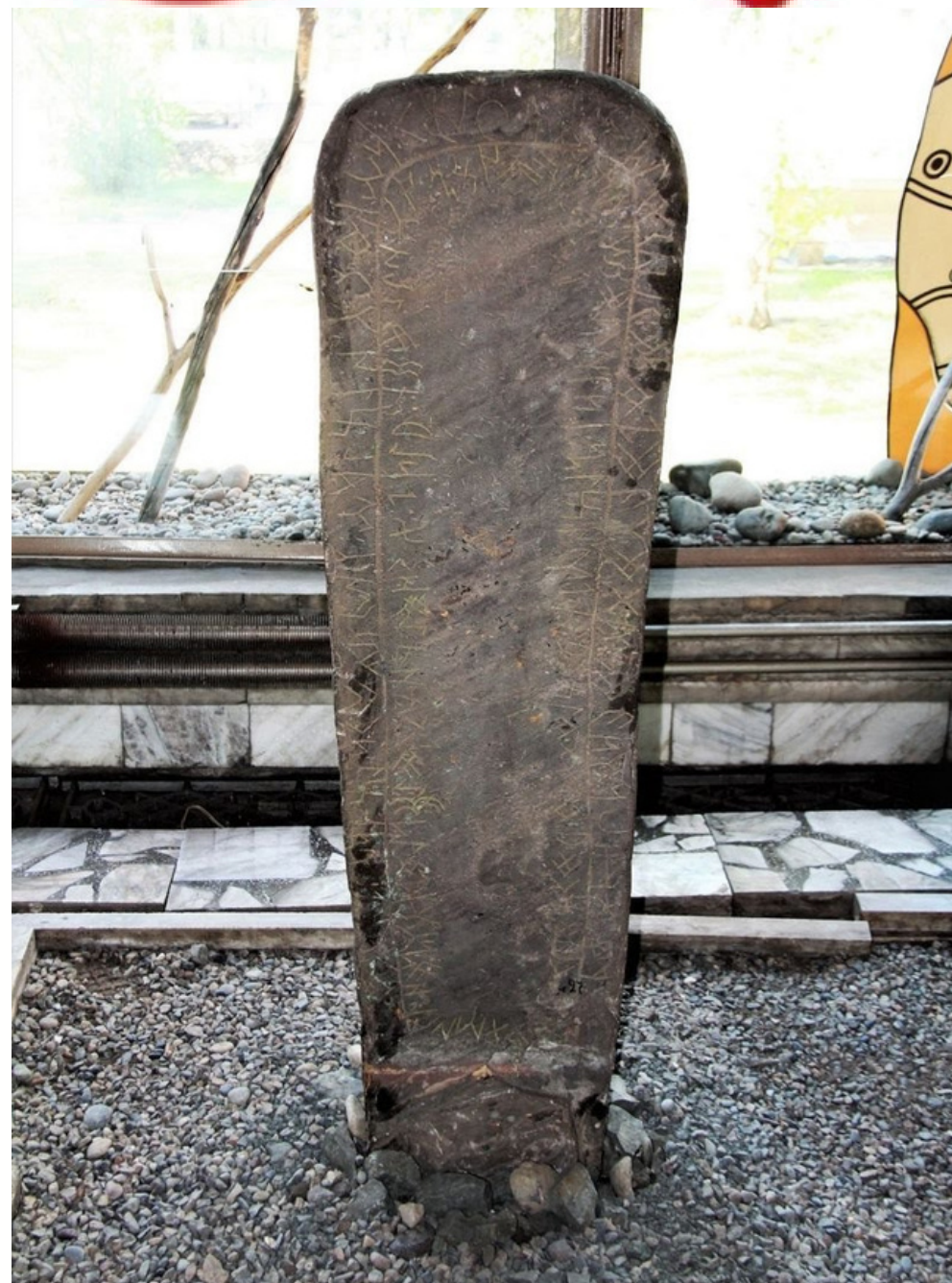
БАРСБЕК КАГАНДЫН ЖАЗМА ЭСТЕЛИГИ

Орхон-Енисей жазуусу же байыркы түрк руникалык жазуусу деген жазуу кыргыз каганатында ырасмий түрдө колдонулган жазуу болгон. Ошол жазуу кыргыздардын алгачкы мамлекеттик тили болуп эсептелет.